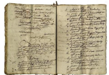
Des cahiers de doléances

Il convoque les « États Généraux » pour en discuter avec les représentants des nobles, du clergé et du peuple. Cette nouvelle enthousiasme les Français qui rédigent partout en France des «cahiers de doléances» demandés par le roi et dans lesquels ils expriment leurs demandes et leurs critiques.