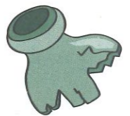
un morceau de verre