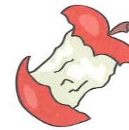
un trognon de pomme