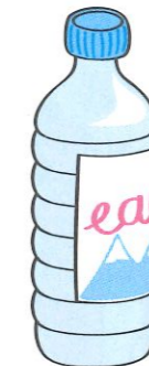
une bouteille en plastique